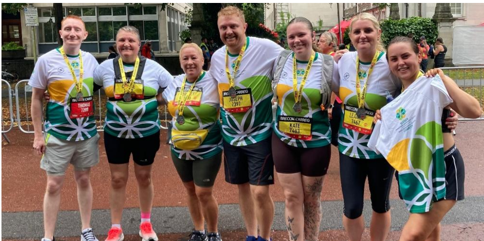
Yn y llun: Cydweithwyr o Orsaf Ambiwylans Y Coed Duon yn rhedeg y CDF10K 2025 er budd Elusen Gwasanaeth Ambiwylans Cymru